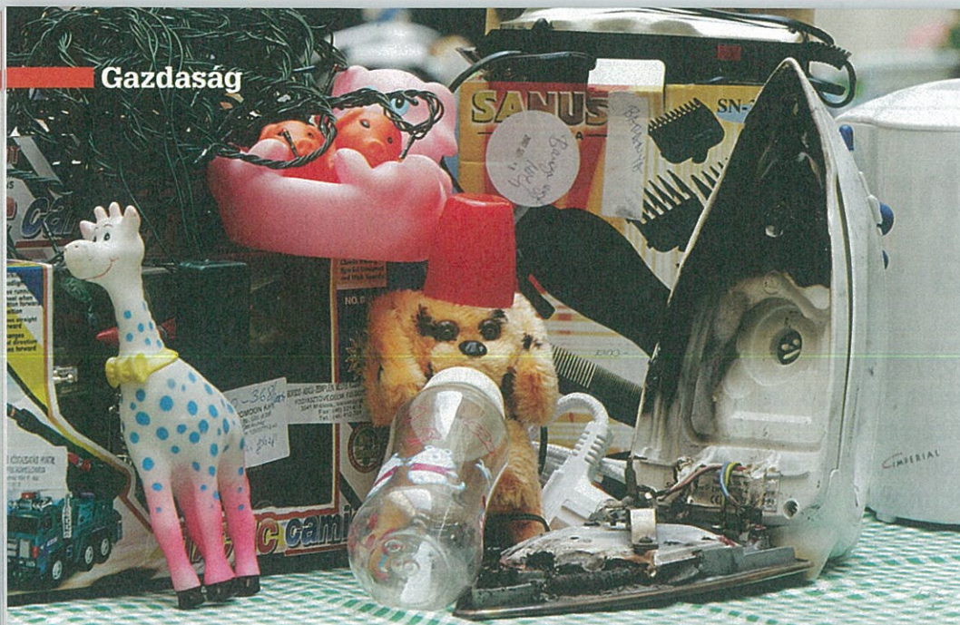
Veszélyes, betiltott termékek. Égő